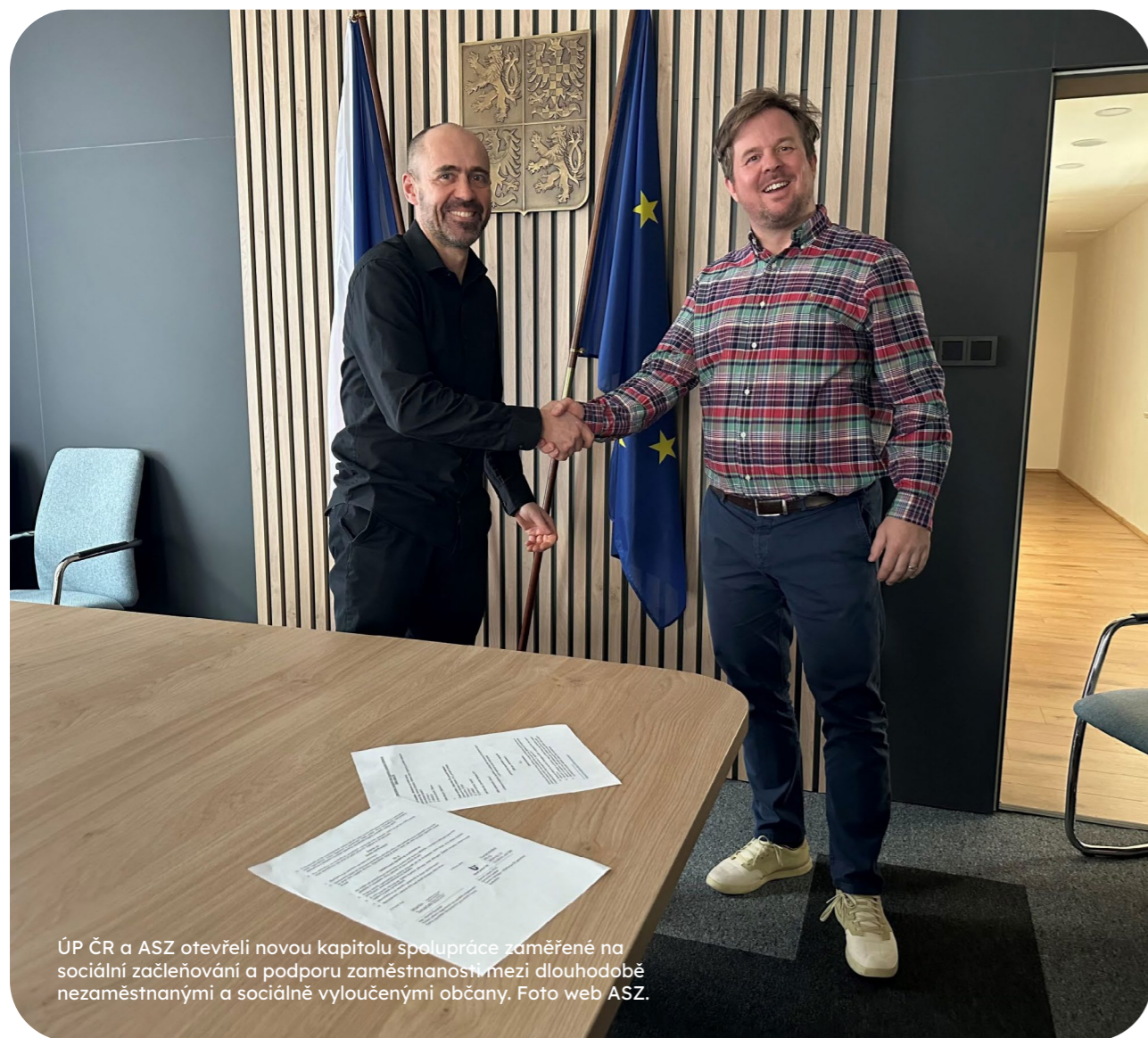
ÚP ČR a ASZ otevřeli novou kapitolu spolupráce zaměřené na sociální začleňování a podporu zaměstnanosti mezi dlouhodobě nezaměstnanými a sociálně vyloučenými občany.

Díky moc za váš čas a hodně sil do vaší další práce.