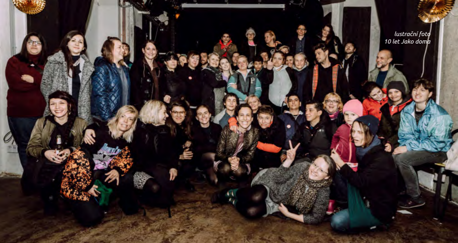
lustrační foto 10 let Jako doma