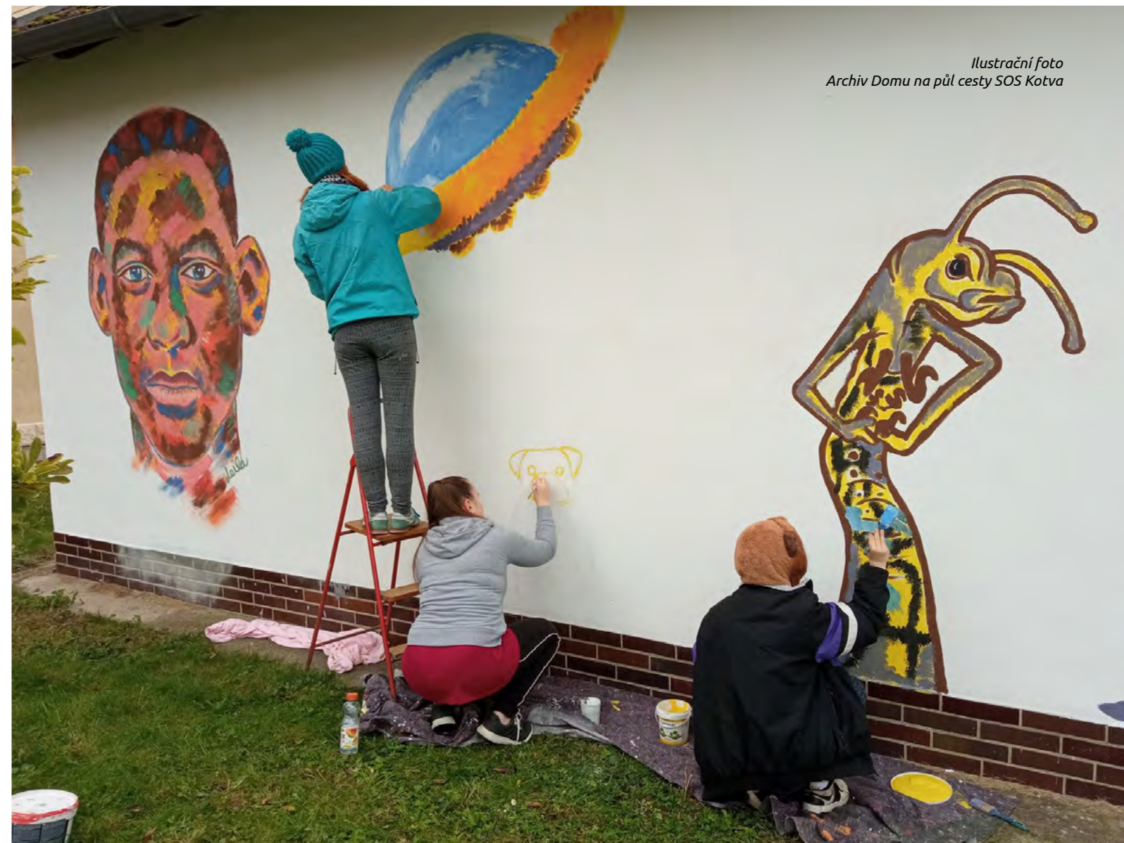
Ilustrační foto Archiv Domu na půl cesty SOS Kotva

Jak jsem již napsala v úvodu, naše služby jsou určené mužům i ženám a ke všem se snažíme přistupovat individuálně dle jejich potřeb, zároveň však dodržovat rovný přístup. Tato praxe se nám osvědčuje a zatím nemáme důvod přemýšlet nad službou, která by byla např. pouze pro ženy. Nemuseli jsme doposud řešit žádnou rizikovou situaci, která by byla způsobena soužitím mužů i žen. Ve službě usilujeme o to, aby tým pracovníků tvořili ženy i muži a mohli jsme tak lépe reagovat na potřeby klientely. Přítomnost pracovníků i pracovník může klientele přinášet potřebné korektivní zkušenosti s jednáním s opačným pohlavím apod.