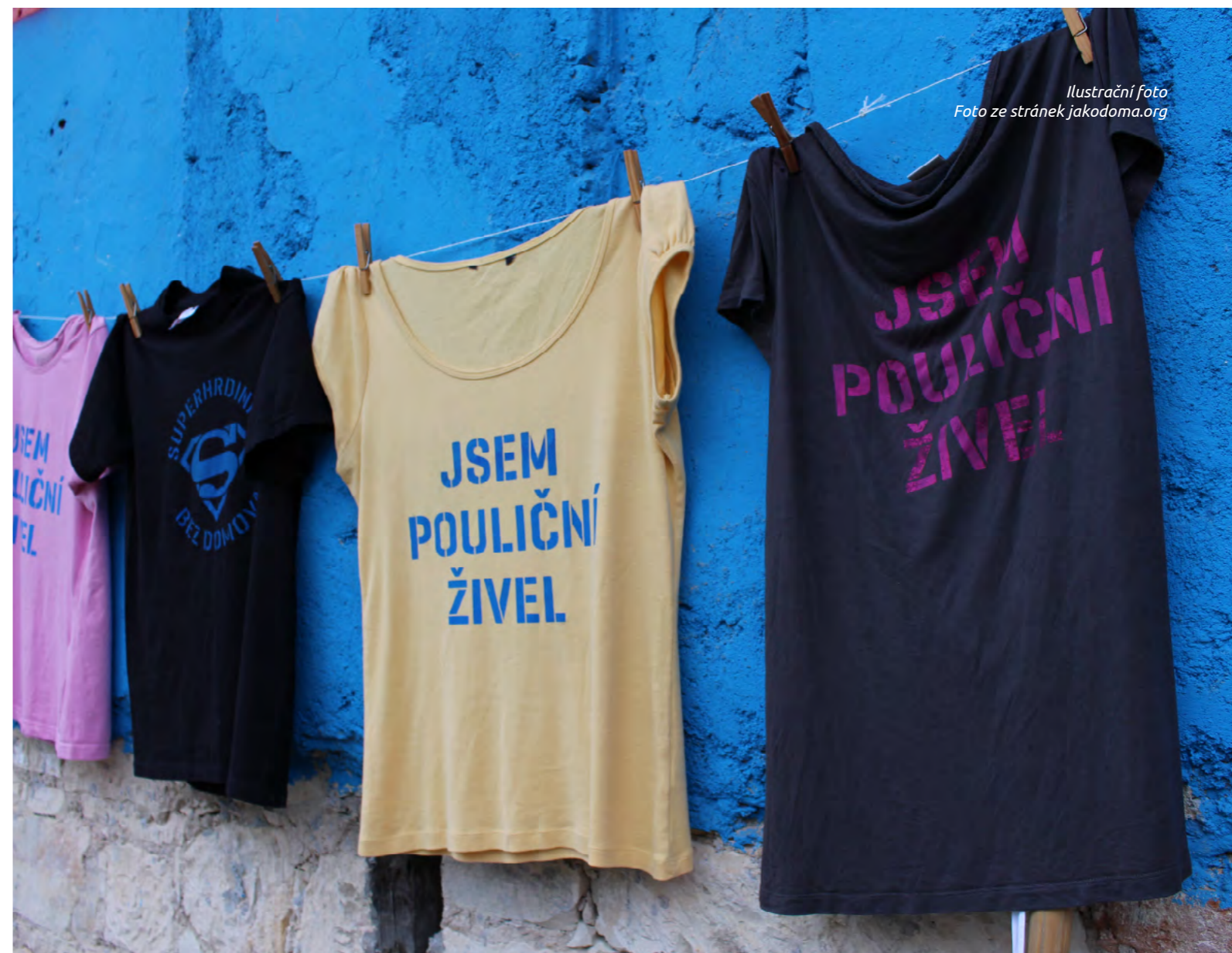
Ilustrační foto

TGEU. Coming Home: Homelessness among trans people in the EU . Evropská unie, 2021 [online, cit. 2023-11-28] Dostupné z: http://tgeu.org/wp-content/uploads/2021/12/tgeu-homelessness-policy-brief-en.pdf